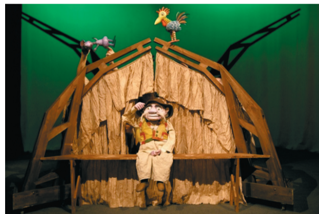
Dziadek i jego radosne zwierzątka w „Bajce o szczęściu”

powrotem sprowadzić do domu swoich przyjaciół, wesole zwierzątka. Niedługo, namówiony przez sprytnego Handlarza, wymienił je za parę przedmiotów. Po jakimś czasie rzeczy te jednak przestały go cieszyć. W smutku wspominał czas, gdy towarzyszył mu kolorowy